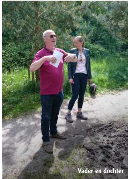
Vader en dochter